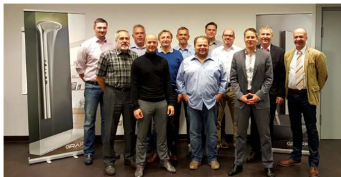
Die Handelsvertreter der Graff GmbH für Deutschland

Graff hat sich für Investitionen in Deutschland entschieden, die hinsichtlich Kundenservice, Technik und Kommunikation beträchtliche Verbesserungen bringen sollen: Die Geschäftstätigkeiten des Unternehmens werden seit Januar 2016 zielgerichtet von der neu gegründeten Graff GmbH in Stuttgart gelenkt, die den Geschäftspartnern bessere Serviceleistungen und Rahmenbedingungen für eine erfolgreiche Vermarktung von Graff-Armaturen und Accessoires bieten kann. In Zusammenarbeit mit einem Dienstleister wird das Serviceangebot in Deutschland deutlich ausgeweitet. Mit der Einrichtung einer deutschen Hotline (0711-50622936) bietet das Unternehmen künftig noch besseren Kundensupport. Zudem steht ein neuer technischer Service für Reklamationen und Reparaturen bereit: Unter der Telefonnummer 07127-9296258 sind Experten und Techniker erreichbar, die auf Abruf deutschlandweite Reklamationsaufträge absolvieren. Dabei steht die Graff GmbH selbst in regelmäßigem Kontakt mit den betreffenden Unternehmen und Endkunden. Graff möchte seinen deutschen Kunden mit dieser Neuorganisation eine noch intensivere Partnerschaft bieten. Zur Qualität der Produkte tritt damit eine deutliche Verbesserung im Dienstleistungsbereich. Weitere Informationen zu Graff finden Sie unter: www.graff-faucets.com .