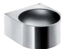
WASCHTISCH FACIL Wandmontage