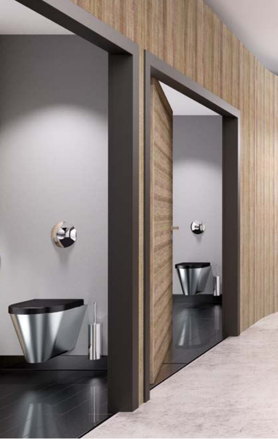
Edelstahl-WCs widerstehen hohen mechanischen Belastungen und minimieren darüber hinaus auch die benötigte Spülmenge und den Wasserverbrauch der gesamten Anlage.