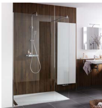
HSK Duschkabinenbau KG

Das Wandanschlussprofil der „Walk In Pro“ von HSK lässt sich auf der Verfließung in der Fliesenfuge oder im Putz wandbündig montieren. Die standardmäßig bis 140 cm oder im Sondermaß bis zu 180 cm breite Frontglasscheibe aus 8 mm dickem Einscheiben-Sicherheitsglas wird in das zuvor fixierte Wandprofil einge-